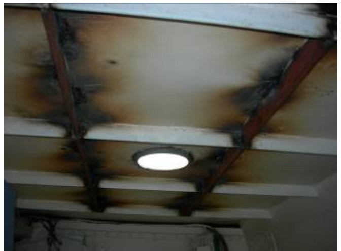
Aanbrengen versteviging stalendek.