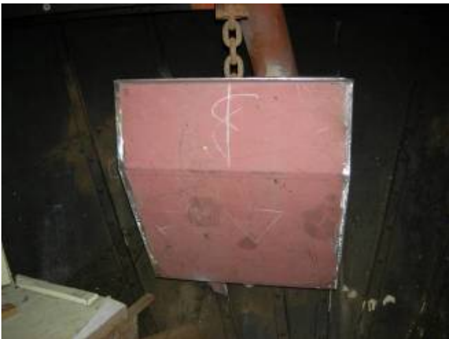
Aanbrengen stalen kettingbak