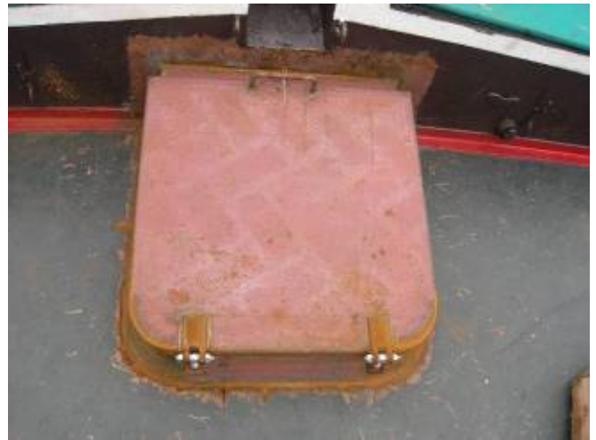
Revisie ingang vooronder en verwijderen restanten koproer