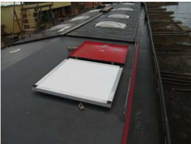
Aanpassen stalen toegangsluik ruim