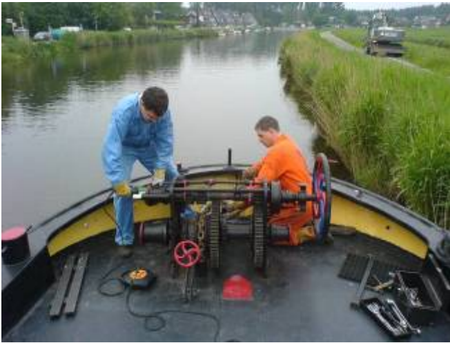
Revisie ankerlier en herstellen fundatie.